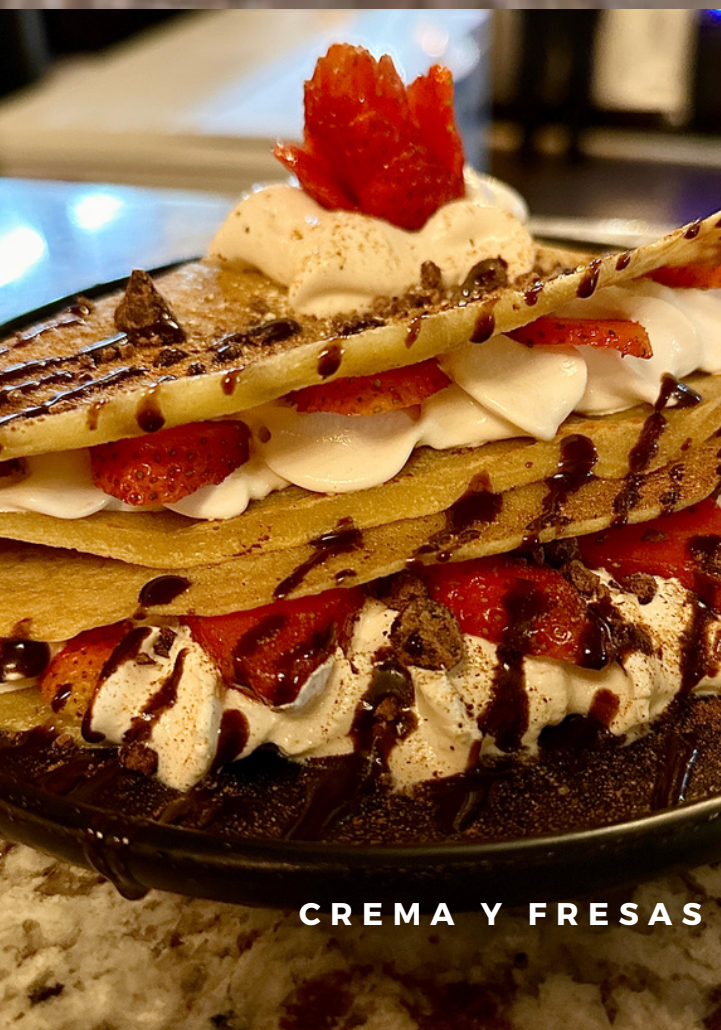
CREMA Y FRESAS