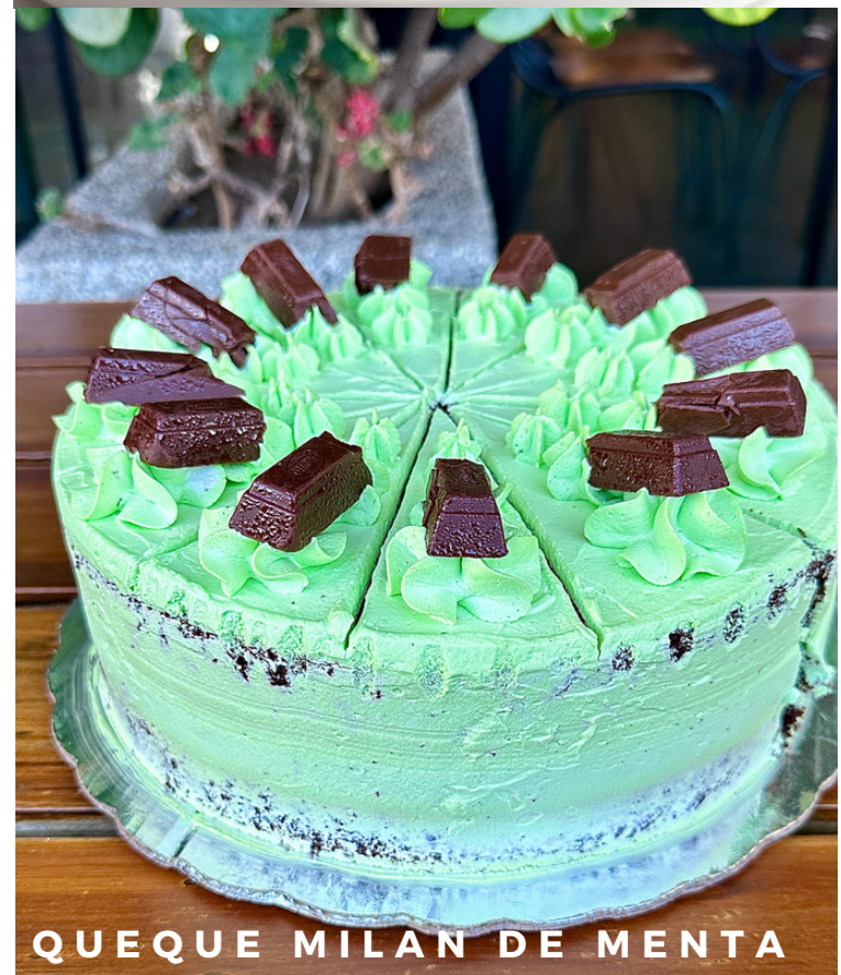
QUEQUE MILAN DE MENTA