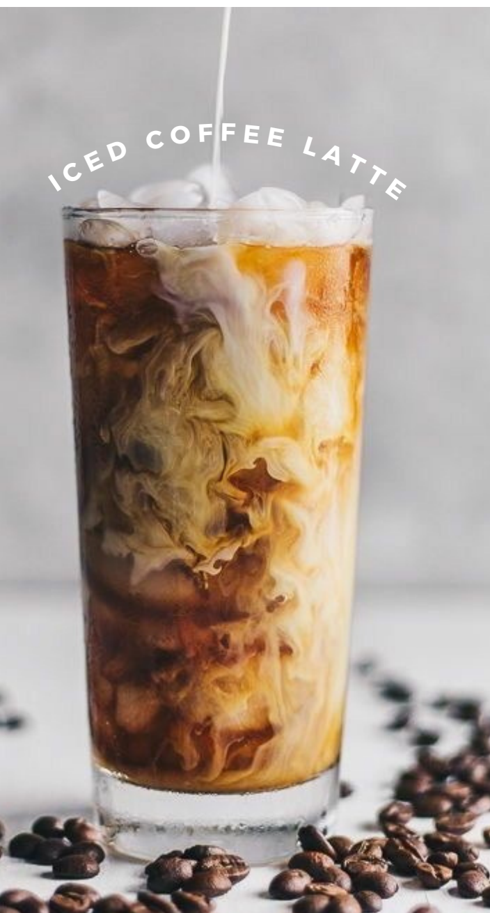
ICED COFFEE LATTE