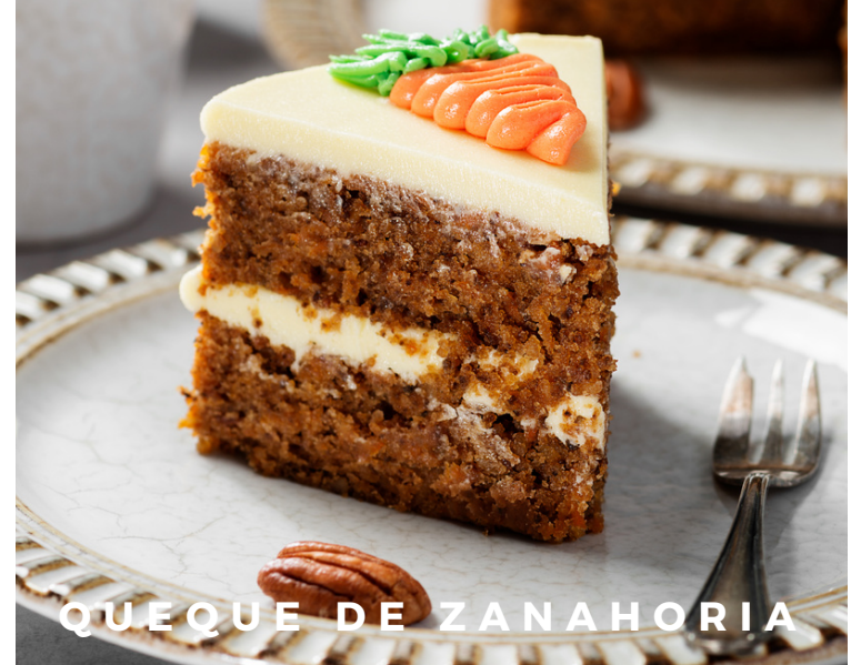
QUEQUE DE ZANAHORIA

UN POSTRE CLÁSICO Y DELICIOSO QUE COMBINA UNA BASE DE GALLETA DESMENUZADA CON UN SUAVE Y CREMOSO RELLENO DE QUESO CREMA. ELIGE TU TOPPING FAVORITO.