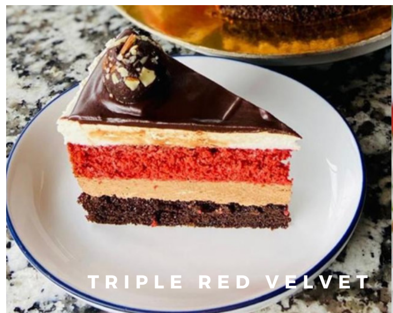
TRIPLE RED VELVET