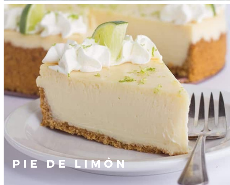
PIE DE LIMÓN