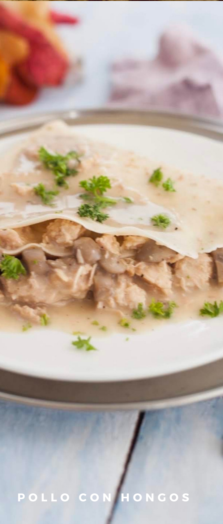
POLLO CON HONGOS